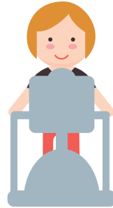
ANDAR EN CINTA RODANTE