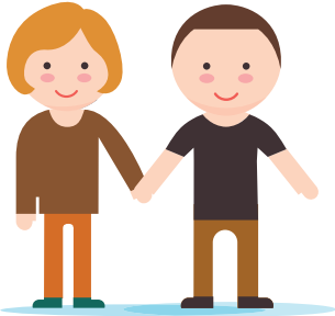
ACTIVIDADES DE BAILE

A día de hoy, los estudios científicos nos indican que son 3 las actividades o ejercicio físico más recomendable para quien padezca la enfermedad de Parkinson